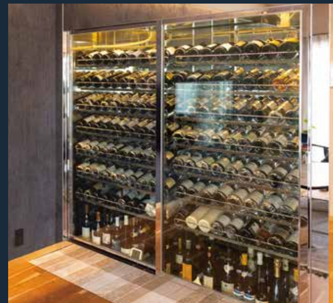
2021.05 model.3 個人宅実績