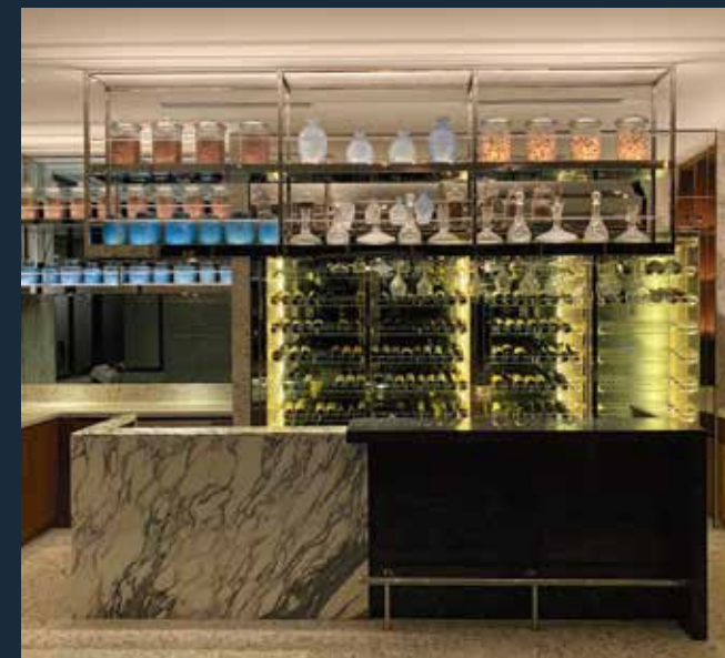
2020.10 model.2 ホテル内レストラン実績