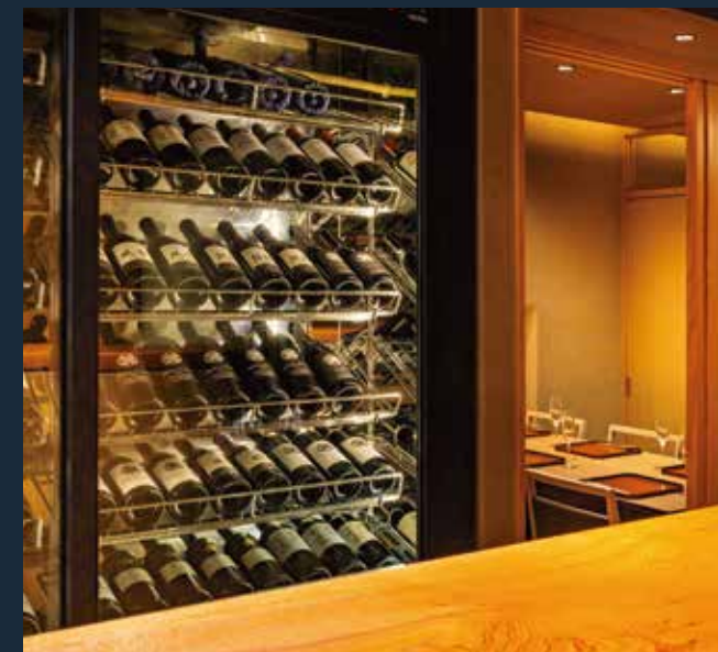
2020.06 model.1 飲食店実績