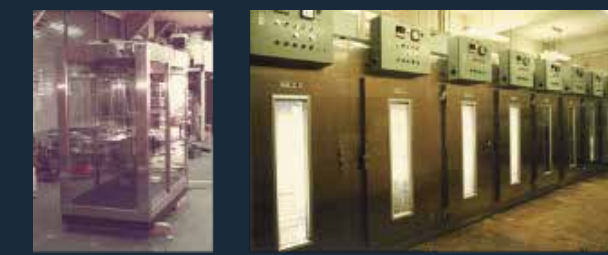
フラワーキーパー、ストッカー